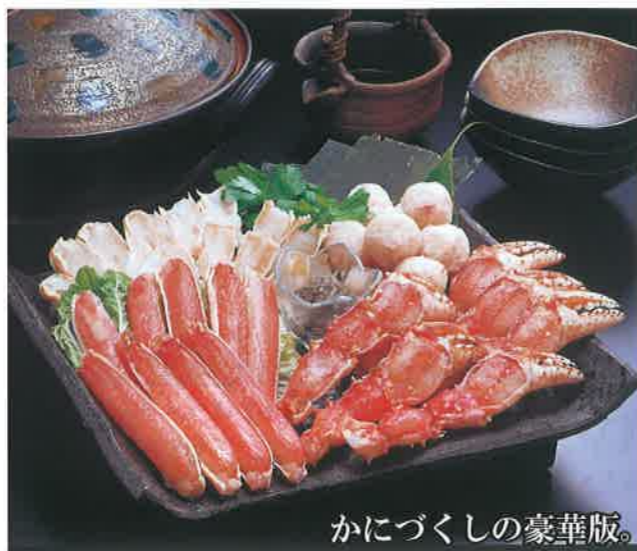
かにづくしの豪華版。